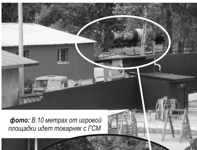
фото: В 10 метрах от игровой площадки идет товарняк с ГСМ

3.6. Уровни шума на территории дошкольных организаций не должны превышать допустимые уровни, установленные для территории жилой застройки.