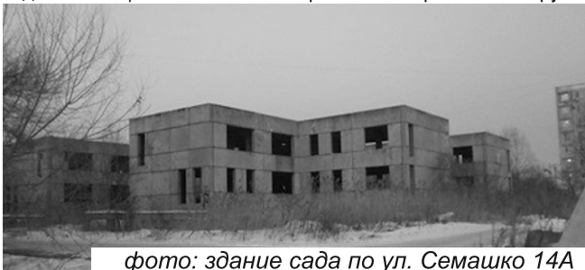
фото: здание сада по ул. Семашко 14А

Затраты на переоборудование 100 дошкольных мест в Отделе Полиции №9 составят по расчётам мэрии 500 тыс. руб.