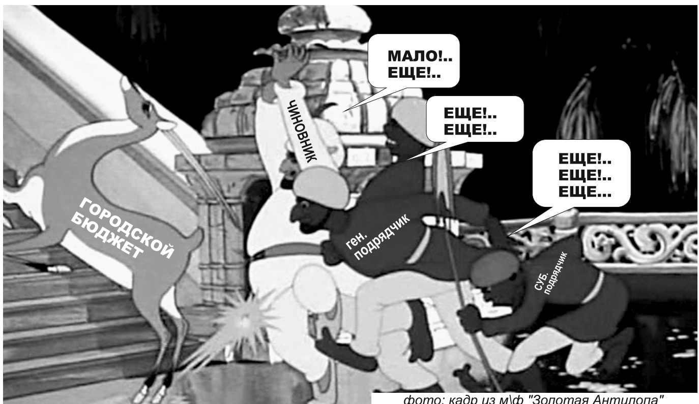
фото: кадр из м/ф "Золотая Антилопа"

Конечно это не последнее результативное взаимодействие НКО и органов местного самоуправления, успешное сотрудничество общественности и власти ради общего блага еще впереди.