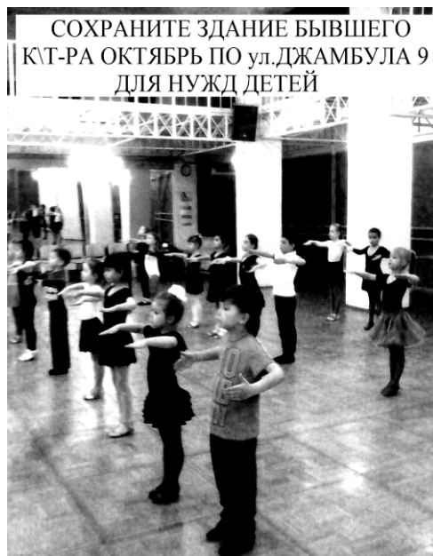
дети - будущее Хабаровска