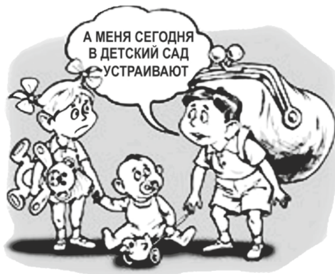
рис. Борьба за выживание по Хабаровски

Не секрет, что все сады загружены сверх нормативных возможностей, группы переполнены, что является нарушениями требований СанПиНа. В таких условиях у детей высокая заболеваемость. Необходимо разгрузить до штатной численности посещения все имеющиеся перегруженные сады. Перегруженность связана и с готовностью администраций МДОУ принять сверх норм тех детей, чьи родители готовы оказать незаконную добровольную спонсорскую помощь.