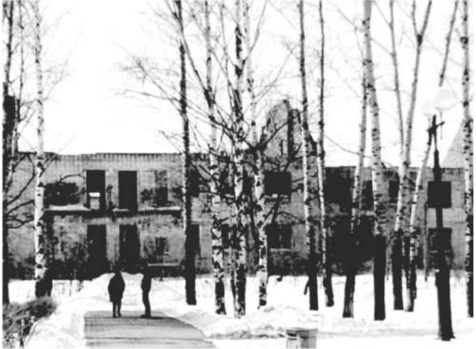
Вот так посажен в генплан микрорайона недостроенный советский сад во дворе дома ДОС№26 (ост. Портовая) который можно восстановить. Вокруг жилая застройка, прилегает рекреационная зона и парковая территория и никаких экологических и т.п. техногенных помех, шум автопотока отсечён застройкой.

районов садами на примере их посадки в генплан на направлении Восточное шоссе Железнодорожного округа.