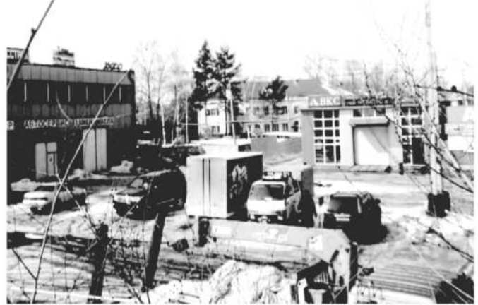
Вот так вписан в генплан микрорайона д\сад №83 на 80 мест, открывшийся в декабре 2012 года по муниципальной программе (ост. Продмаш, пр. 60лет Октября 141А). Вдали 2-этажное здание сада и игровая площадка зажатая складами, зданием автоцентра и проездами к ним техники различного назначения. Детский сад расположен между Автоцентром и бараками, в 50 м. от оживленного проспекта 60летия Октября и 10 метрах от опор контактной сети ж\д путей с проходящими по Транссибу поездами.