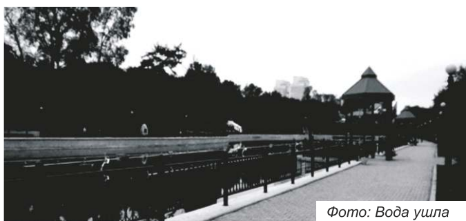
Фото: Вода ушла

Когда мы видим порыв и фонтан воды, бьющий из под земли, то экстренно применяются аварийные меры устранения порыва ведь эти формажорные аварийные потери будут оплачены горожанами. Но почему на новом столь инновационном и дорогостоящем городском фонтанном комплексе закрываются глаза на очевидную техническую аварийность его функционирования?