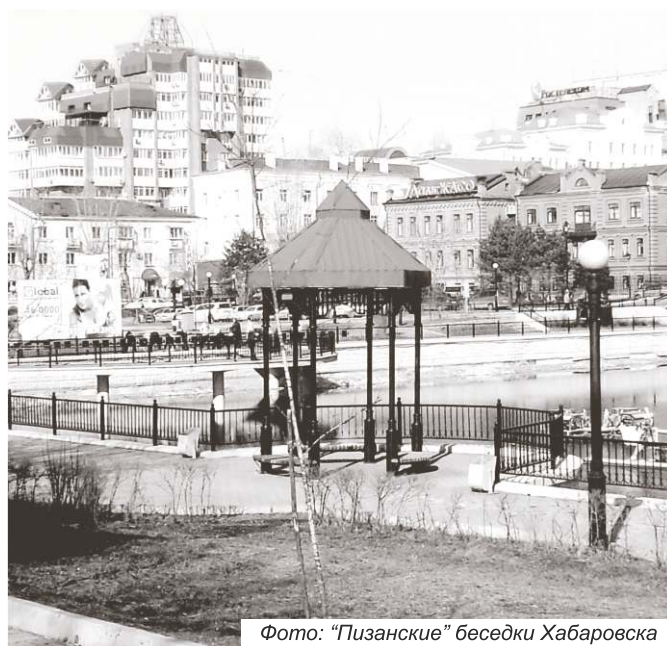
Фото: "Пизанские" беседки Хабаровска