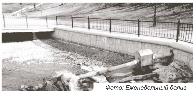
Фото: Еженедельный долив