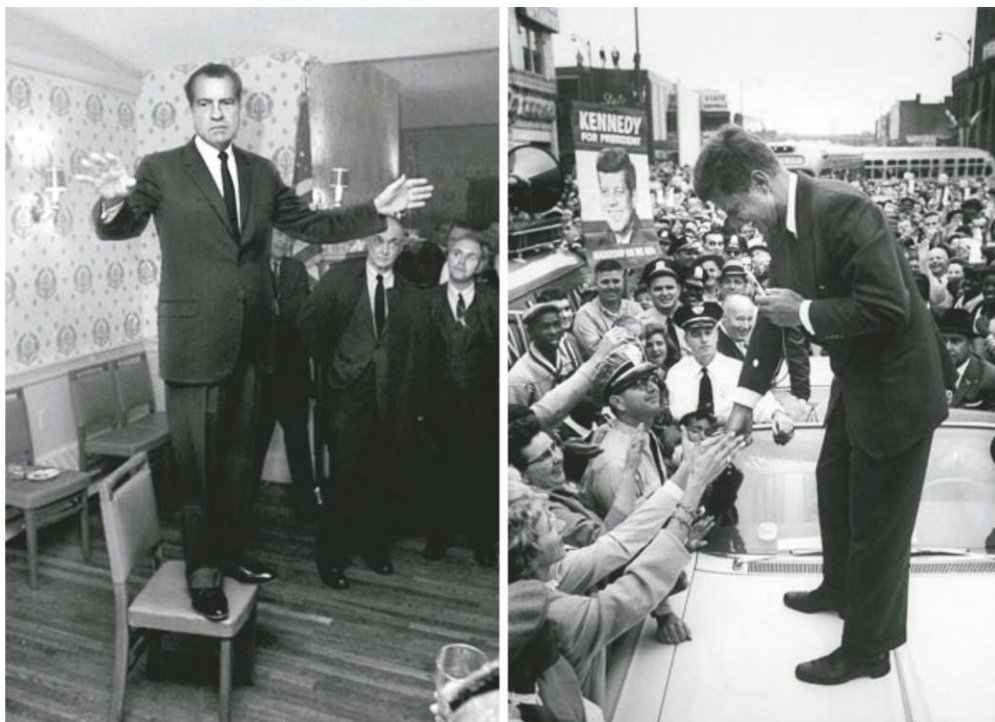
Ричард Никсон выглядел помятым и под каждым стулом видел врага. Неудивительно, что в оптимистичном 1960-м американские избиратели предпочли ему элегантного, богатого и беззаботного Джона Кеннеди.