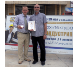
На отраслевой региональной выставке

В Советской Гавани закончил общеобразовательную и музыкальную школы.