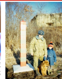
Будни охраны государственной границы РФ.

С 2012 г. занимается исключительно общественно-политической деятельностью: Председатель регионального отделения политической партии «Родная Страна»; Сопредседатель НКО «Центр Гражданских Инициатив» г. Хабаровск; Главный редактор общественно-политической газеты «Гражданская Инициатива».